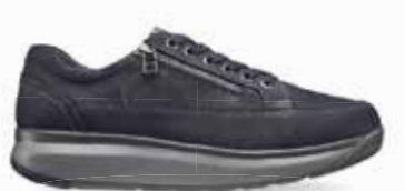
Bruno Dark Blue