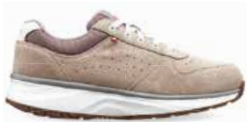
Dynamo Classic W Beige

We hebben deze schoenen met zacht elastische zolen voor u klaar staan zodat u heerlijk een stukje kunt gaan wandelen en het unieke gevoel van Joya kunt ervaren.